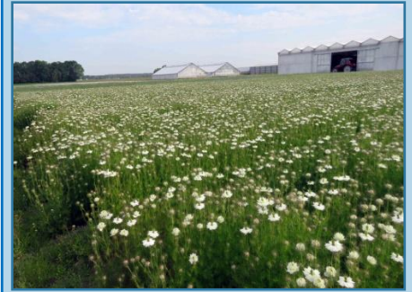
Nigella's, Juffertje in 't Groen, Ranonkelfamilie